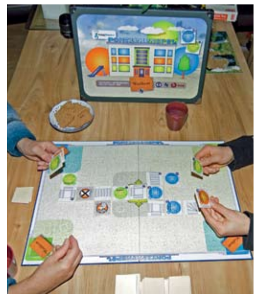
Leefregelspel ontwikkeld door Haag Wonen