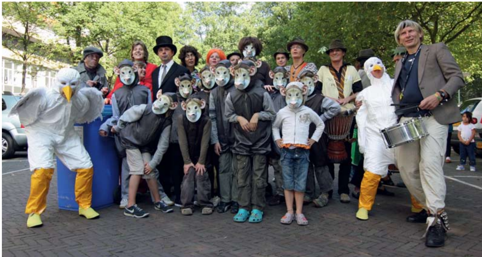
Verklede jeugd uit Mariahoeve die samen met theatergezelschap Facet op 27 september kriskras door de wijk het stuk 'Rattenvanger van Mariahoeve' opvoerden, om aandacht te vragen voor de overlast veroorzaakt door zwerfpuil in de wijk.

Veel bewoners in de wijk ondervinden overlast door ratten en vogels. Die bestaat onder meer uit vervuilde straten door open-gescheurde vuilniszakken, verzakte stoepen door rattenholen en vervuilde ramen en balkons door vogelpoep. De overlast ontstaat doordat ratten en vogels eenvoudig aan eten komen. Door niet goed aangeboden huisvuil en etensresten in het gras, kunnen vogels vuilniszakken openpikken en ratten hun buik rond eten.