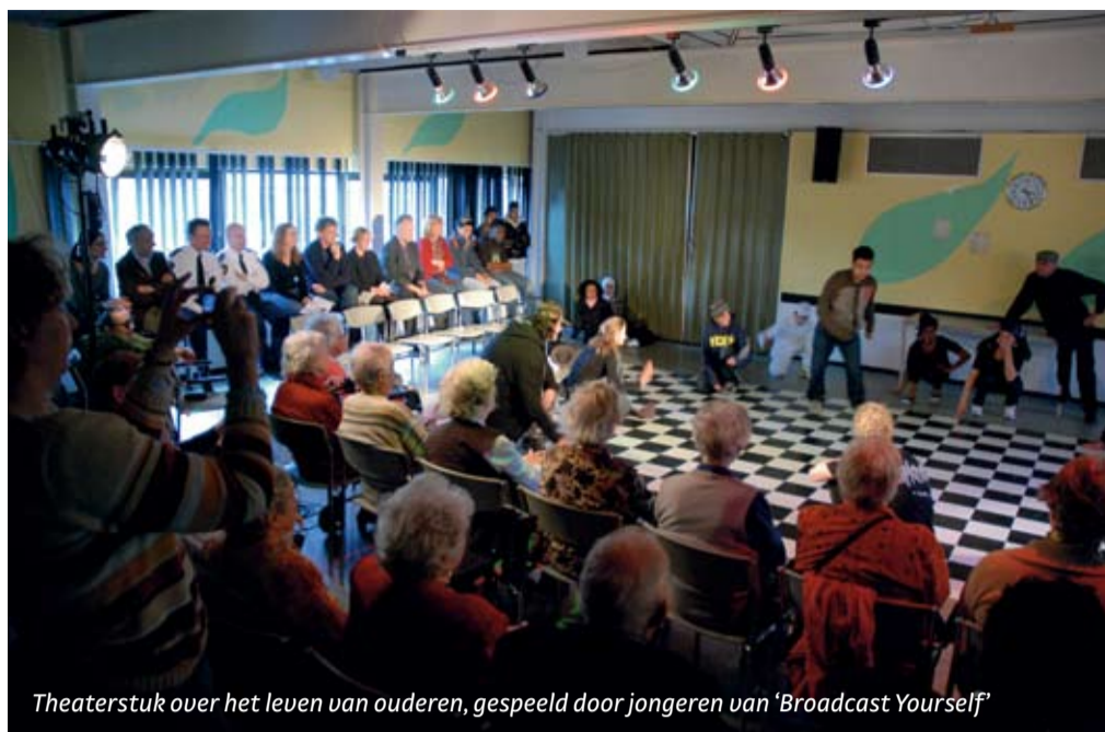
Theaterstuk over het leven van ouderen, gespeeld door jongeren van 'Broadcast Yourself'