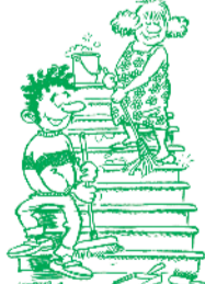
Houd samen met de buren het portiek schoon