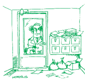
Geen vuilniszakken en oud papier in het portiek