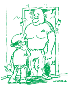
Heeft u ergens problemen mee? Spreek uw buren hier op een rustige manier over aan